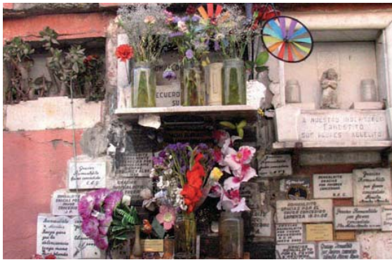
Figura 11 Romualdito, Patio 34