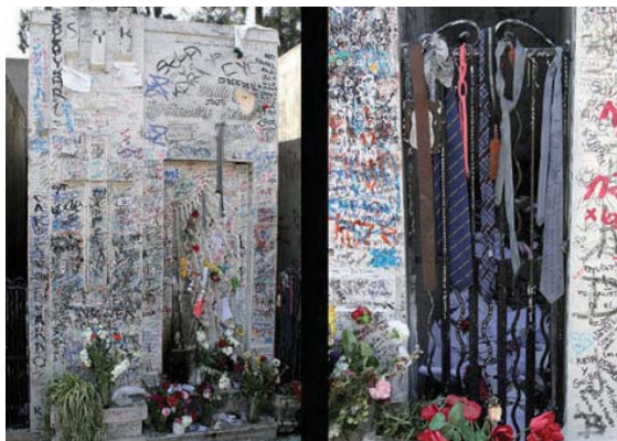
Figura 8 La Novia, Patio 70

Ubicación: Patio N° 82, avenida Limay vereda norte, entre calles Nicolás Vicuña y Alejandro del Río.