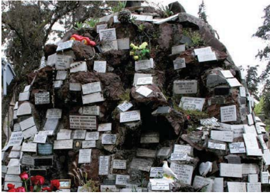
Figura 2 Cristo Rico, Patio 50, detalle.

Descripción: La fisonomía es casi idéntica a la del Cristo Rico. Sin embargo no está ubicada en un punto tan neurálgico ni en una plazoleta y aunque no es tan concurrida, tiene marcas potentes de devociones populares.