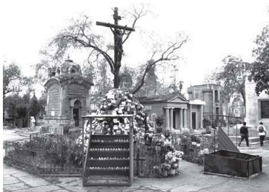
Figura 1 Cristo Rico, Patio 50

Tipología: Pira funeraria con crucifixión en intersección de calles.