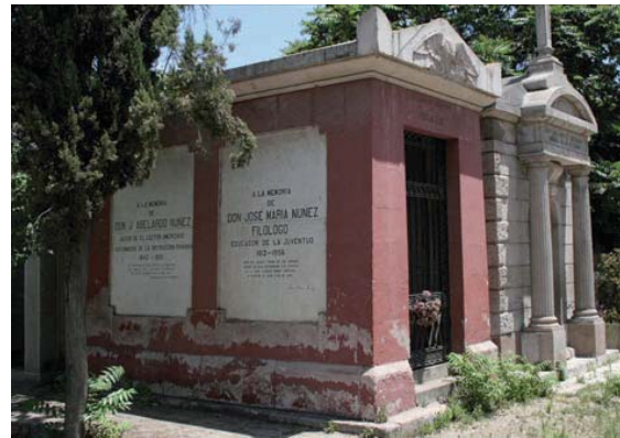
Figura 7 Abelardo Núñez, Patio 24

Las peticiones se asocian al éxito en el rendimiento escolar y se manifiestan a través de mensajes. Pese a ser una devoción antigua hace algunos años fueron borrados los rallados del mármol y fue pintada la piedra, no habiendo evidencias actuales del culto.