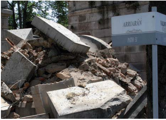
Figura 13 Manuel Arriarán, Patio 51