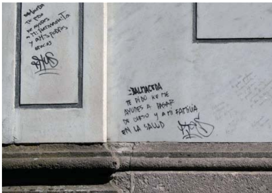
Figura 6 José Manuel Balmaceda, detalle

pido por favor que me cuides durante mi vida y ayúdame en la prueba de historia. Gracias de antemano. Que dios te tenga en sus brazos; Pedimos para que nos vaya bien en estos años de carrera, Bendiciones; Balmaceda, ya estoy sano.