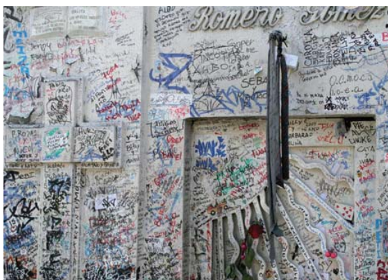
Figura 9 La Novia, detalle