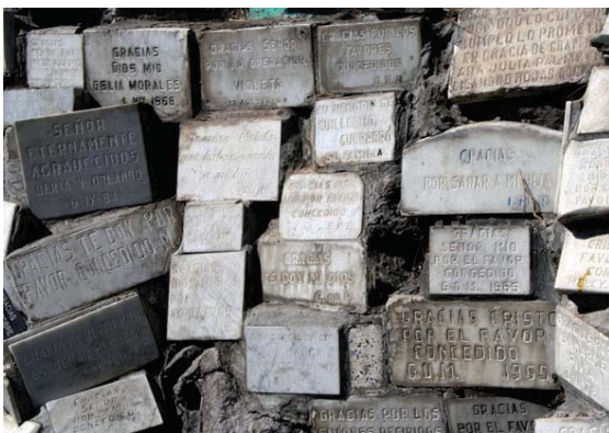
Figura 4 Cristo Pobre, Patio 64, detalle