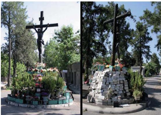
Figura 3 Cristo Pobre, Patio 64

Sus fieles recurren a él con peticiones por escrito y el mármol de la fachada es persistentemente llenado de graffiti y en el interior son arrojados papeles y cartas con peticiones. Balmaceda, ayúdame a tomar buenas decisiones; Cuida a mi familia; Ayúdame a pasar de curso y cuida a mi familia; Te pido por todas las familias y la gente muertas; Te pido para que siga la lucha intensa de los estudiantes; Te pido por mis hermanos y que ya no los tengo conmigo y que pase de curso; Te