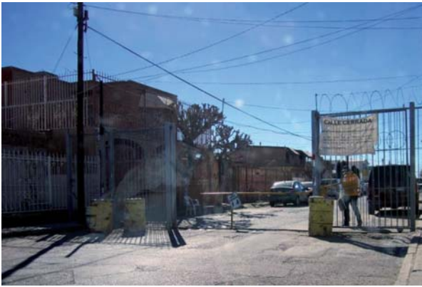
> Figura 1. El imaginario que se representa en fraccionamientos cerrados que realmente se encuentran abiertos