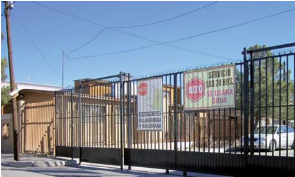
> Figura 2. El cierre de calles sólo disminuye los delitos menores