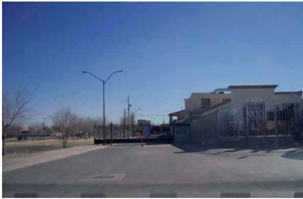
> Figura 3. La apropiación del espacio público resulta en una sensación de seguridad, del apartarse de los Otros

protección y depositar su confianza de ellos y sus familias en el cierre de calles. Queda claro que esto es una manera de reclamo ante las instituciones gubernamentales de parte de los ciudadanos por las elevadas cifras de criminalidad que se han venido presentando.