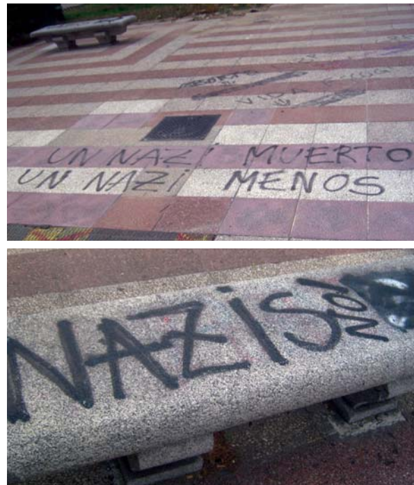
> Fotografías 9 a 10. Plataformas de inscripción

Según Gasnier (2004:34), l'appropriation peut d'abord être définie comme un processus psycho-spatial, individuel ou collectif, qui reflète une forme de liberté de disposer d'un espace, de détenir une pseudo-propiété selon des usages propres (c'est-à-dire des formes d'occupation des lieux) et des signes culturels spécifiques. L'appropriation est une forme de pratique sociale et spatiale qui caractérise une relation privilégiée aux lieux. Las ilustraciones precedentes demuestran que hay apropiación y desvío del espacio urbano, acto deliberado y subjetivo que los habitantes o residentes de la ciudad llevan a cabo individual o colectivamente para manifestar su pertenencia al espacio social. El modo o la técnica de apropiación dependen de los tipos de lugares y de los actores que actúan. Éstos últimos se clasifican en dos categorías en función del lenguaje inscrito o pintado en el espacio. Así, la inscripción directa en la pared o superficie de los muros u otros sitios se atribuiría a un acto ilegal si se considerase la normativa en materia de la ocupación del espacio