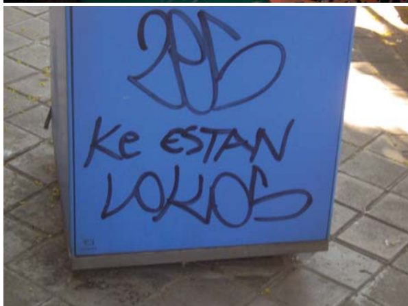
> Fotografías 5 a 6. Modalidades de disposición y apropiación