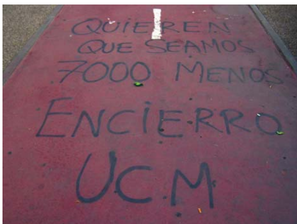
> Fotografías 7 a 8. Invasión del plano horizontal

en los muros. La ocupación del espacio no sólo se inscribe en las condiciones normales y naturales de la actividad humana, sino que se enmarca también el llamado espacio humano. De hecho, cuando no hay preparación previa y para motivos singulares, el espacio de inscripción en las paredes supera difícilmente los dos metros de alto. Por otro lado, la recepción y la audiencia de dicha obra artística quedan garantizadas por su perspectiva más o menos frontal con respecto al observador. Por lo general, son fachadas que dan a la calle, al patio o a un espacio abierto; lo que confiere más envergadura a la apropiación y propicia tanto el proceso de producción como el de recepción del discurso subsiguiente.