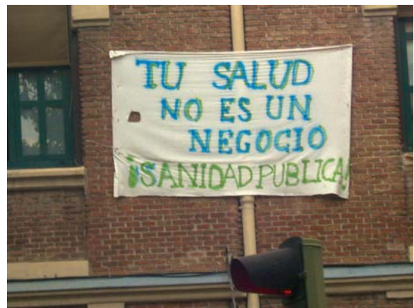
> Fotografías 1 a 4. Apropiaciones de los muros