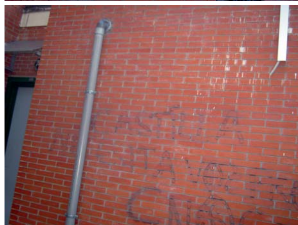
> Fotografías 13 a 15. Interacciones