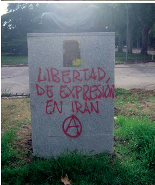
> Fotografías 11 a 12. Apropiación gráfica

temps de le légitimer. Le marquage de l'espace correspond de ce point de vue à ce que l'on pourrait appeler dimension spatiale de la violence symbolique, dans le sens défini par Pierre Bourdieu (Bourdieu, 1993). Le marquage fonctionne comme violence symbolique lorsqu'il inscrit dans la durée l'affirmation de formes d'appropriation de l'espace, dont le caractère socialement arbitraire finit par ne plus être perçu, en évitant donc le recours permanent à la force pour imposer un pouvoir sur un espace donné.