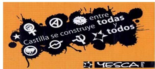
> Foto 16. Una pegatina de la Yesca, sacada de su sitio web: http://juventudrebelde.org/

En esta perspectiva de identificación de los actores sociales a los cuales atribuir el discurso reivindicativo conviene mencionar el fenómeno de los llamados indignados, es decir, los hechos sucedidos el 15 de mayo de 2011 en Madrid (en adelante 15-M) dentro de la historia de los movimientos sociales que se originaron en España desde la transición democrática (Schencman, 2012:449). Según Molina Carvajal. (2012:1), la relevancia y peculiaridad de los indignados está en directa relación con el tipo de discurso que articulan en sus movilizaciones (contenido), sus formas de comunicar y coordinar sus demandas (instrumentos y medios) y finalmente el nivel de impacto de sus acciones y convocatoria ciudadana (fenómeno global) . Los movimientos protestatarios y los contextos crisisógenos que se dan a observar por toda Europa han, sin lugar a dudas, tenido repercusiones en los indignados españoles. La crisis en España y la consecuente suscripción del programa de reajuste estructural, así como el temor a experimentar la austeridad a la griega o italiana, provocan un sentimiento de indignación que no deja de materializarse en el espacio público.